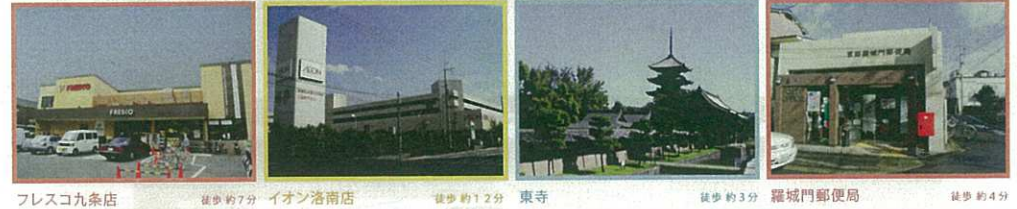
フレスコ九条店 徒歩約7分 イオン洛南店 徒歩約12分 東寺 徒歩約3分 羅城門郵便局 徒歩約4分