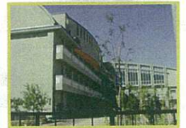
南大内小学校 徒歩約1分