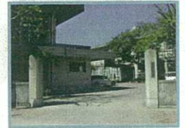
八条中学校 徒歩約9分

※プラン図につき柱・梁・壁等が増える可能性があることをあらかじめご了承ください。